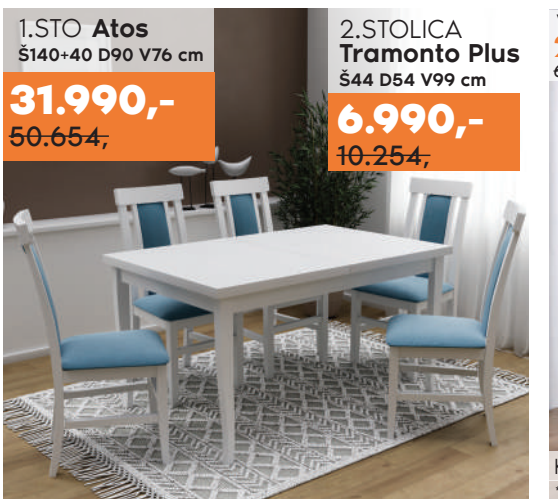
1.STO Atos Š140+40 D90 V76 cm