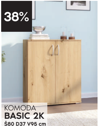
KOMODA BASIC 2K Š80 D37 V95 cm