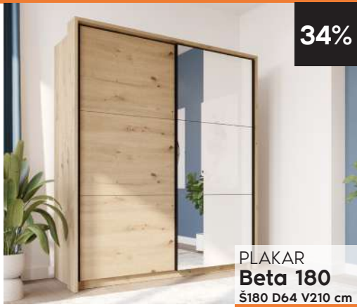
PLAKAR Beta 180 Š180 D64 V210 cm