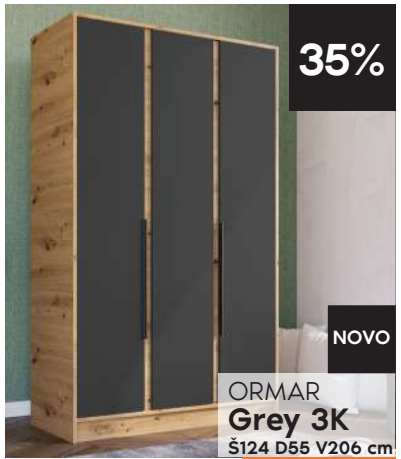
ORMAR Grey 3K Š124 D55 V206 cm