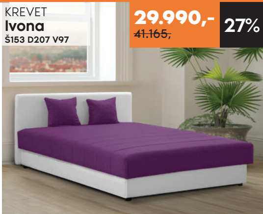
KREKET Ivona Š153 D207 V97