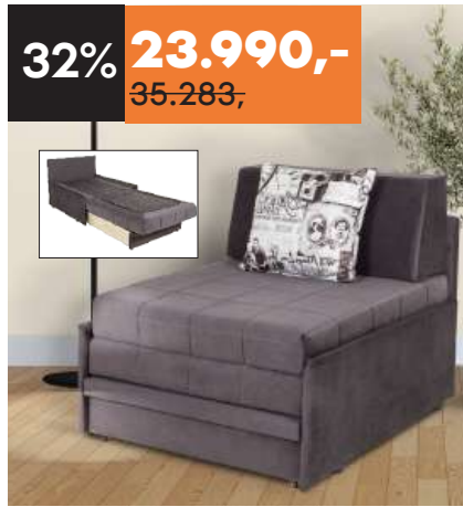
FOTELJA Knjiga Š90 D100 V83 cm Rasklop Š80 D190 cm