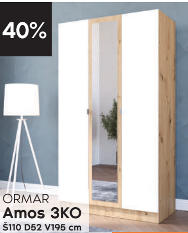
ORMAR Amos 3KO Š110 D52 V195 cm