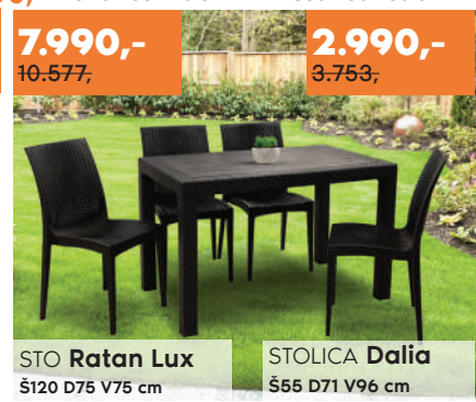
STO Ratan Lux Š120 D75 V75 cm