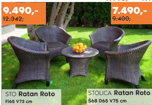
STO Ratan Roto F165 V73 cm