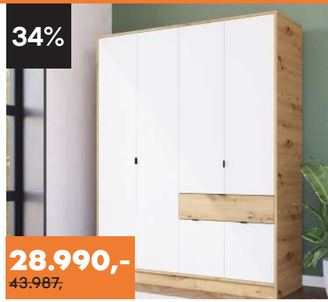
ORMAR Kent 160 Š163 D56 V207 cm