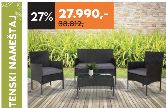
BAŠTENSKI SET Ronda STO Š71 D41 V39 cm DVOSED Š104 D58 V84 cm FOTELJA Š57.4 D58 V84 cm