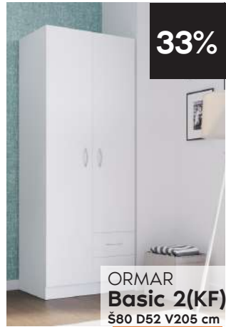
ORMAR Basic 2(KF) Š80 D52 V205 cm