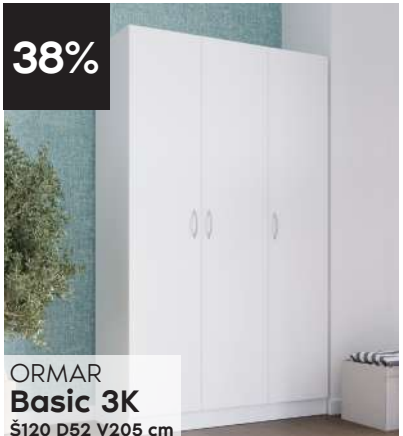
ORMAR Basic 3K Š120 D52 V205 cm