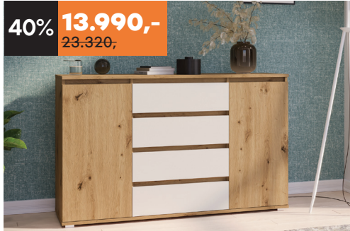
KOMODA Kala 2K4F Š140 D43 V87 cm