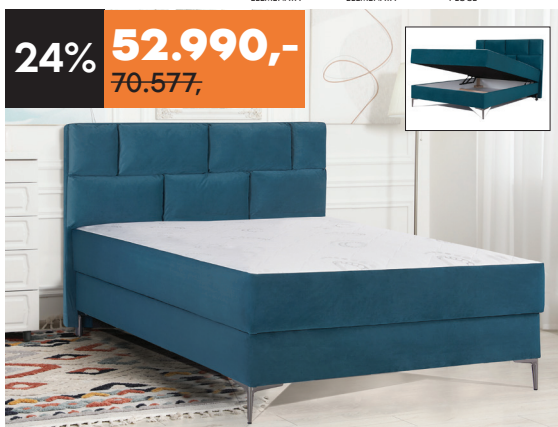
FR. LEŽAJ Brick Š168 D212 V121 cm